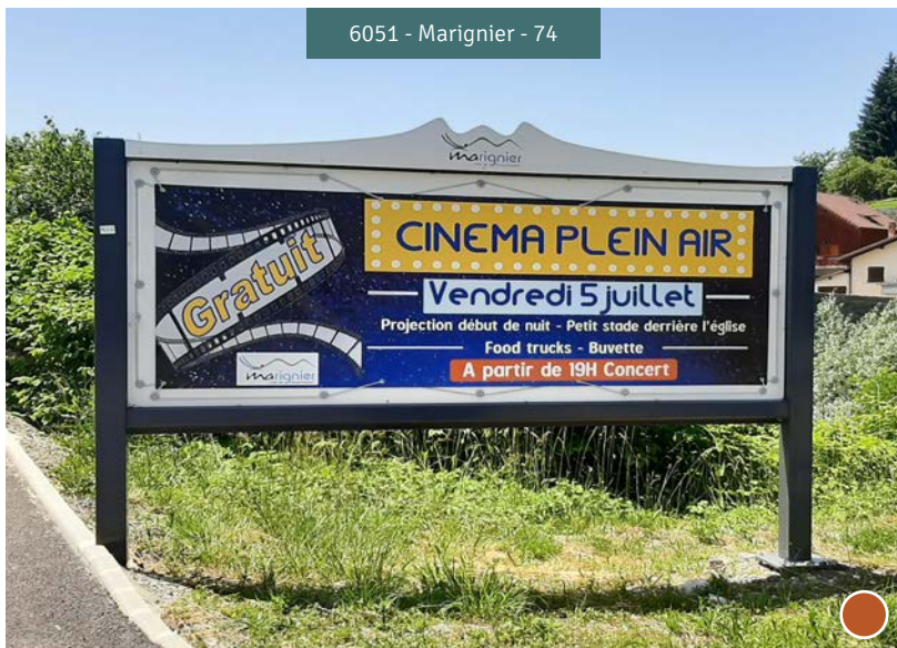
6051 - Marignier - 74