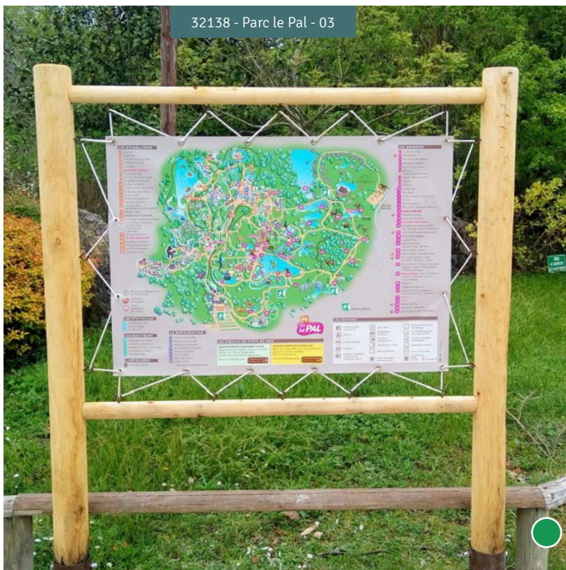
32138 - Parc le Pal - 03