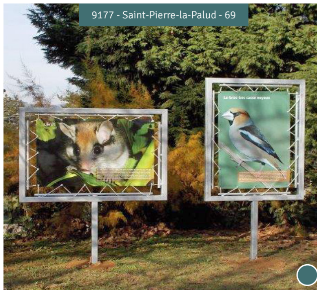
9177 - Saint-Pierre-la-Palud - 69