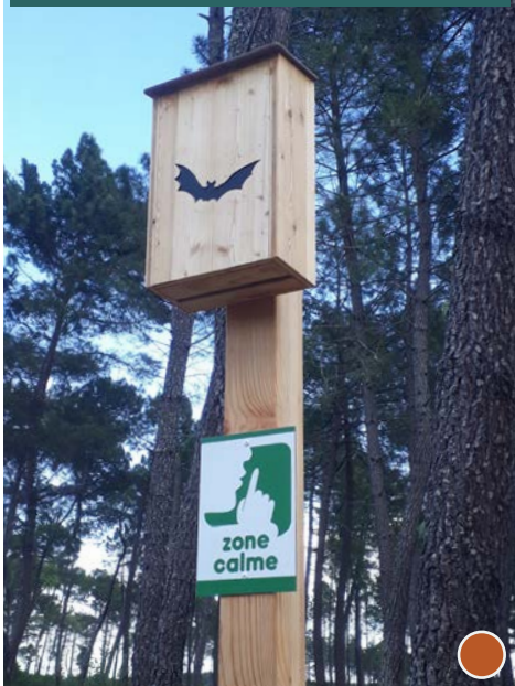
21421 - Center Parcs Les Landes de Gascogne - 47