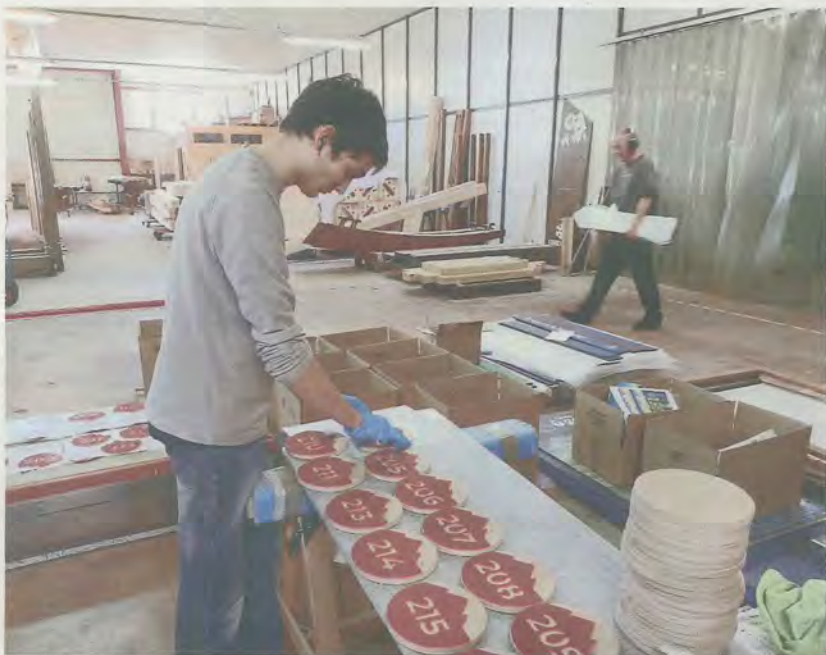
Cet employé réalise des panneaux pour une résidence.