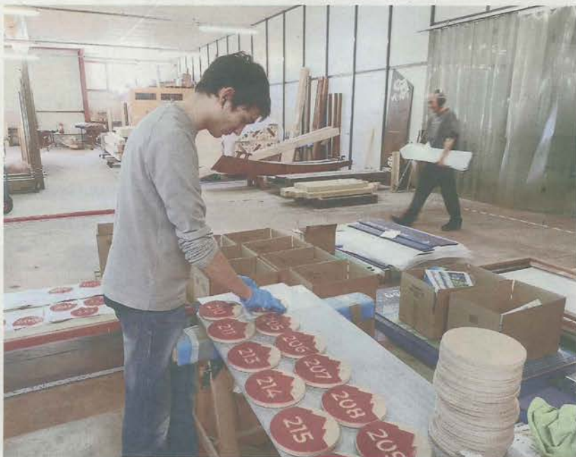
Cet employé réalise des panneaux pour une résidence.