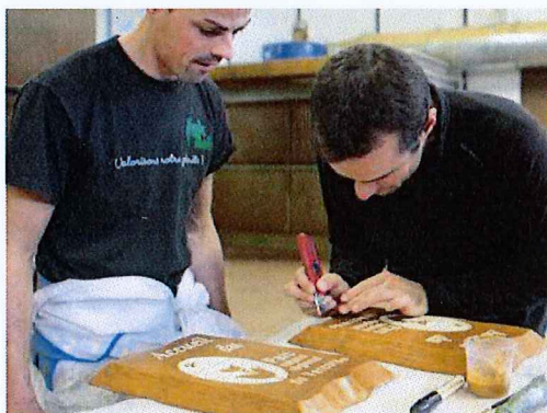
■ Deux employés en train de finaliser la réalisation de panneaux pour le parc naturel du Vercors.