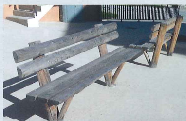
Bancs de la gamme FURCA®