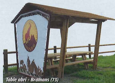
Table abri - Bramans (73)