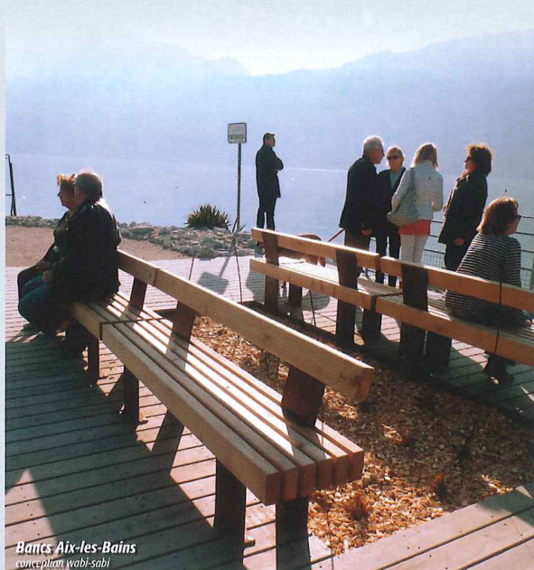
Bancs Aix-les-Bains conception wabi-sabi

Aujourd'hui, cet engagement est salué par le Ministère de l'Environnement et l'ADEME (Agence de l'Environnement et de la Maîtrise de l'Énergie) qui lui ont attribué, en novembre dernier, le Prix entreprise & environnement 2016 mention PME Remarquable dans la catégorie Intégration du développement durable dans l'entreprise. Parmi les 170 candidatures, le groupe PIC BOIS s'est distingué par sa capacité à s'adapter et sa quête de nouveautés. Son positionnement environnemental lui a fait gagner en compétitivité économique et sociétale. C'est ce qui lui vaut aujourd'hui cette reconnaissance nationale.