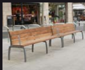
KIWI Nahtrang Disseny