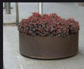
MORELLA 120 Helio Piñón